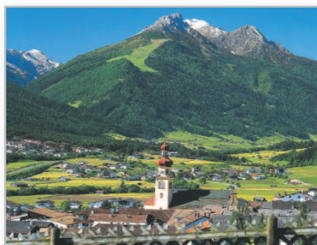
Fulpmes im Stubaital