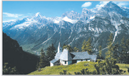
Im Gschnitztal

Ihr Reiseleiter entführt Sie in eine Welt, die längst verloren scheint. Die Rundfahrt führt Sie in die Bergbauernregion von Schmirntal, Obernbergtal und Gschnitztal. Mit etwas Glück kann man im