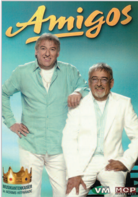
Amigos

Tirol – ein Fest für Augen, Ohren und Seele! Das „Herz der Alpen“ – ein Stück Bilderbuchtirol erwartet Sie bei dieser Reise ins Stubaital, inmitten einer imposanten Hochgebirgswelt. Umgeben von einem Kranz majestätischer Berge und Gletscherriesen finden Sie ein Urlaubsparadies, das seinesgleichen sucht. In den typischen Tiroler Alpentälern hat sich noch viel von der alten bäuerlichen Kultur bewahrt. Das zeigt sich besonders im Herbst, wenn nach einem langen Almsommer die prächtig geschmückten Kühe beim Almabtrieb das Tal erreichen. Da wird ein zünftiges Fest gefeiert und Sie können dabei sein. Die Reise wird garniert mit einem Konzert der „Amigos“, seit vielen Jahren bekannt aus Funk und Fernsehen.