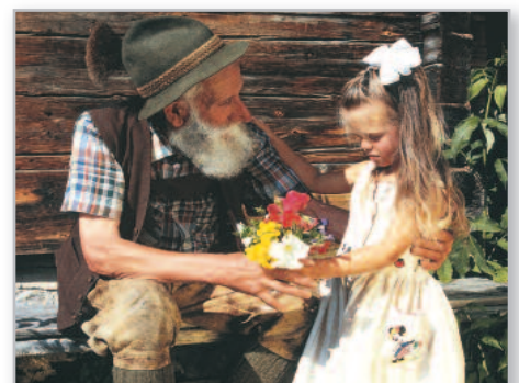
Bäuerliche Idylle