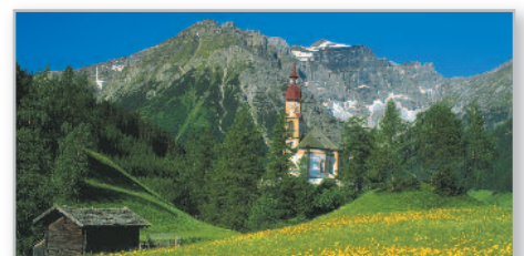
Im Obernbergtal