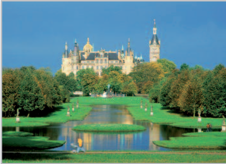
Schweriner Schloss

Lassen Sie sich von Onka Tours in eine der wohl noch ursprünglichsten Landschaften Deutschlands entführen – mit unberührter Natur, Wäldern, Seen und weiten Feldern. Die Städte und Dörfer liegen verstreut in der ganzen Region. Jedes besitzt seinen besonderen Reiz, hat oft einen eigenen See mit Badestelle und eine meist romantisch gelegene Kirche.