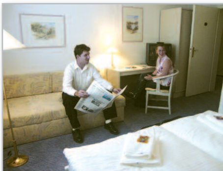
Zimmerbeispiel Hotel Reutereiche

Erleben Sie die Mecklenburgische Großseenlandschaft mit ihren Flüssen und Seen, Wäldern und Wiesen. Mit über 2.000 großen und kleinen Wasserflächen bildet die Gegend eine faszinierende Landschaft. Zunächst fahren Sie zu den ältesten Eichen Deutschlands, die bis zu 1200 Jahre alt geschätzt werden. Sie lernen Neubrandenburg kennen, das man auch die Stadt der vier Tore nennt und mit seiner norddeutschen Backsteingotik zum Kulturerbe Europas gehört. Anschließend fahren Sie auf der deutschen Alleenstraße über Neustrelitz – im Land der 300 Seen – nach Röbel. Von hier aus