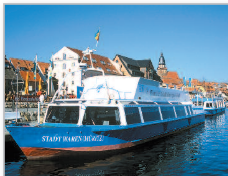
Waren an der Müritz

1998 erhielt Neuruppin anlässlich des 100. Todestages des in Neuruppin geborenen Dichters Theodor Fontane den Namen Fontanestadt verliehen. Es gibt viel zu entdecken. Genießen Sie 750-jährige Stadtgeschichte. Gegen Abend erreichen Sie voller neuer Eindrücke Ihre Ausgangsorte.